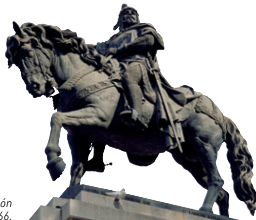
Jaime I de Aragón entró en Murcia en 1266.

Esta fracasada rebelión provocó cambios importantes en el poblamiento del reino, ya que muchos moriscos huyeron de sus tierras , que fueron repartidas entre nuevos colonos castellanos y aragoneses.